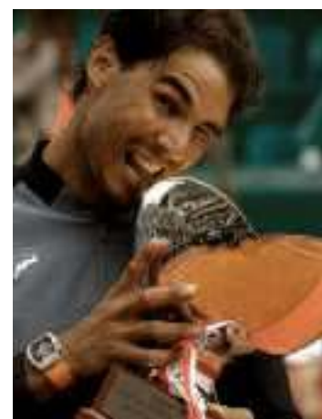
Il 68esimo trionfo

carriera, nel giorno della sua centesima finale - mette così fine a un calvario iniziato a gennaio, quando era uscito al primo turno in Australia, e proseguito poi nella tournée sull'amata terra battuta in Sudamerica. «È stata una settimana importante per me - dice Nadal, che ha sconfitto in sequenza due dei primi quattro giocatori dell'Atp -. Sapevo di star meglio rispetto a un anno fa, ma dovevo provarlo sul campo».